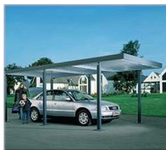
přístřešek cena cca 90 % ceny garáže