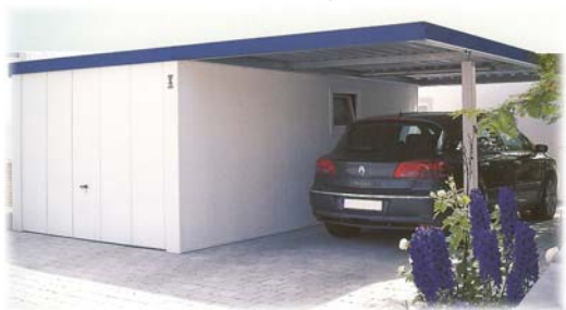
garáž s přístřeškem