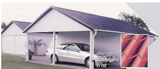
garáž + přístřešek se sedlovou střechou o 100 % vyšší cena než u garáží s plochou střechou