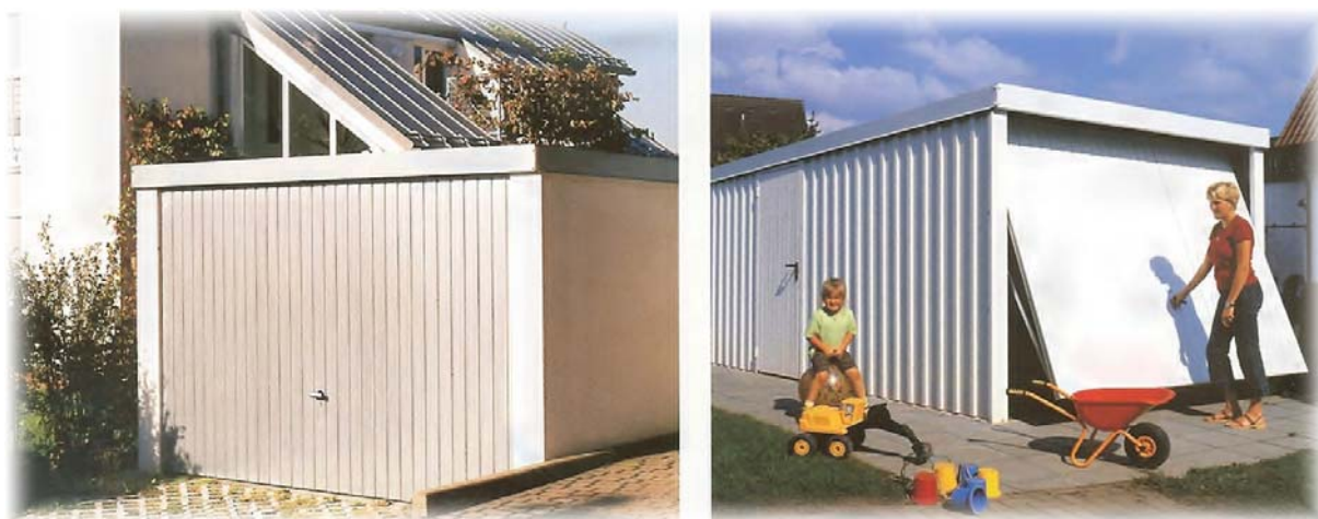
Vlevo : garáž s hladkými stěnami ( + cca 30 % proti garáži s profilovanými stěnami – vpravo )