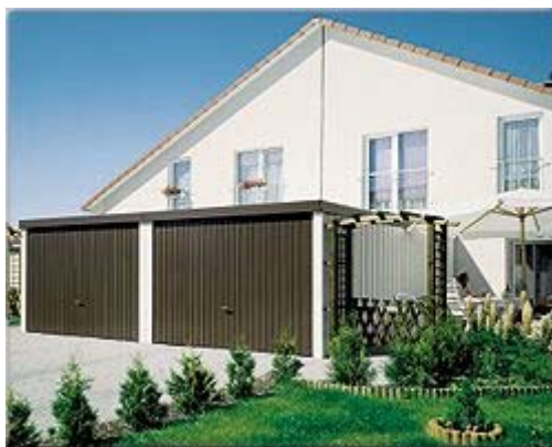
Luxusnější – garáže se sedlovou střechou a integrovaným přístřeškem :