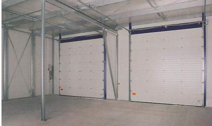
Izolovaná hala – pohled zevnitř.