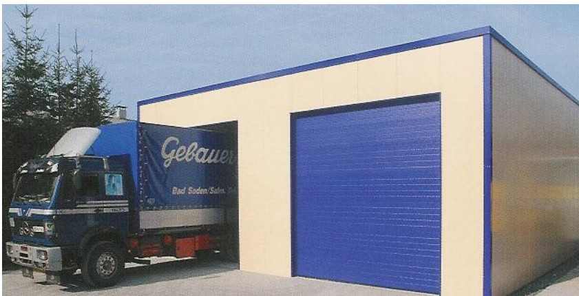
Nahoře : Izolovaná servisní dvojgaráž pro nákladní vozidla