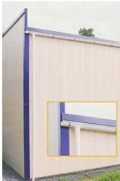
Detail řešení odvodu dešťové vody na zadní hraně mírně šikmé střechy