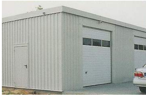
Nahoře nezateplená hala – bílý „omítkový nástřik“, sekční vrata s jednou prosklenou sekci.