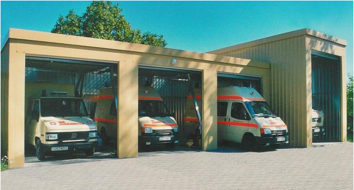
Pohled na řadovou sestavu skladů –garáží - provedení písková barva – práškově metal.technologie nástřiku