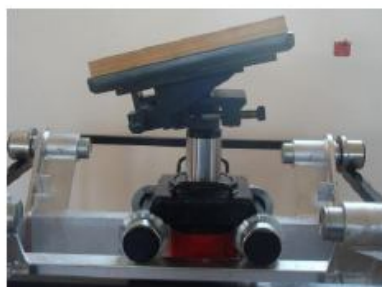
Přípravek pro mont. a demont. převodovky TR/P 800 - nosnost 800 kg