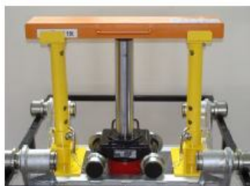
Podpěrný systém - nosnost 10 tun