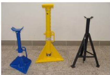
Podpěrné stavitelné stojany - nosnost 1,5 - 7 tun