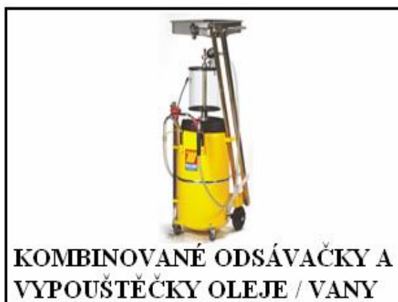
KOMBINOVANÉ ODSÁVAČKY A VYPOUŠTĚČKY OLEJE / VANY