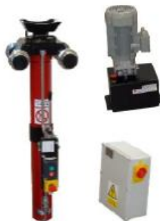
Elektro-hydraulické s hydr. agregátem na zvedáku JZ-EH-E