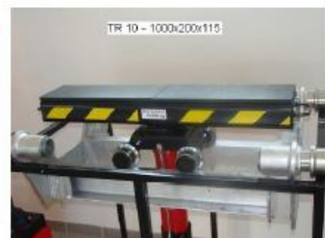
Traverza TR 10 - nosnost 10 tun