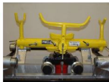
Přípravek pro mont. a demont. převodovky TR/P 1000 - nosnost 1000 kg

Na požádání Vám rádi zpracujeme nabídku na vybrané zařízení. Další vybavení na našich http:// www.autotech-chotebor.cz , případně na poptávku.