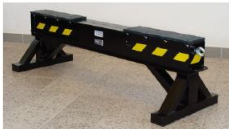
Podpěrný stojan - nosnost 10 tun