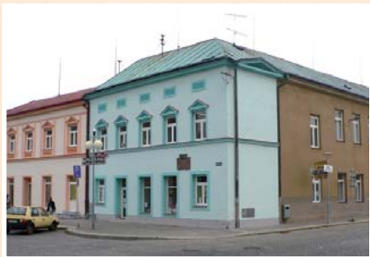
Nová tvář školy z roku 2007. Pohled z Horního náměstí.

Prvopočátky profesního odborného vzdělávání v našem regionu najdeme hluboko v historii Humpolce. Už ve školním roce 1877/78 byla zahájena výuka v pokračovací průmyslové škole v Humpolci. Z historického hlediska je 130 let zanedbatelný okamžik, z pohledu člověka dlouhá doba. Školou prošly již stovky pedagogů, tisíce studentů, z mnohých se stali profesně zdatní odborníci, na řadu lze pohlížet jako na šířitele kultury a tradic národa. Mezi jinými nelze nepřipomenout i Aleše Hrdličku, světoznámého antropologa, který na školu, její učitele a na to „...místo v třetí lavici tam na kraji...“ vždy rád a s vděčností vzpomínal. V průběhu času prošla škola řadou změn. V současnosti je Střední škola SČMSD v Humpolci moderně vybavenou školou s 376 žáky, kteří jsou vyučováni v 10 třídách čtyřletého maturitního, 4 třídách tříletého učebního a 2 třídách dvouletého nástavbového studia. Škola se na základě potřeb podnikatelských subjektů zaměřuje na nejpotřebnější obory a profese. V tomto školním roce jsme začali pracovat na vlastním vzdělávacím programu, který šíjí na míru žákům naší pedagogičtí pracovníci. Koncem roku 1992