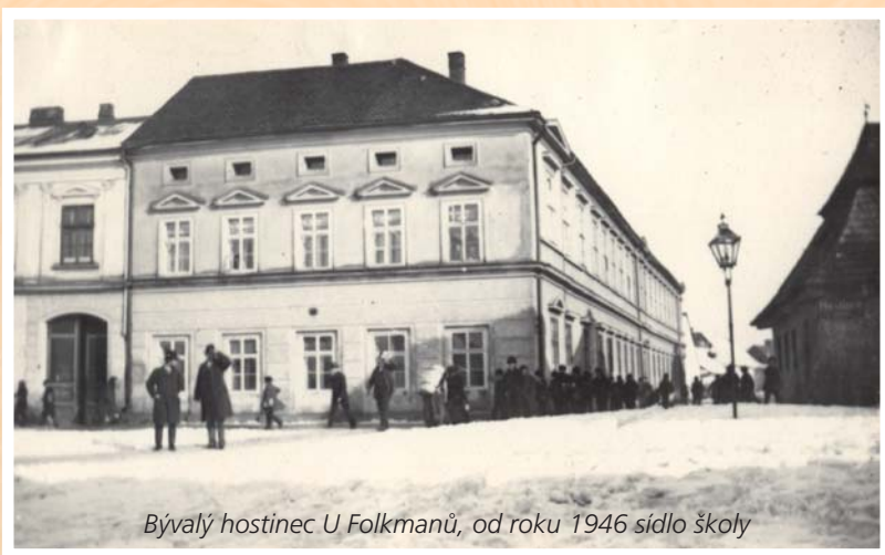
Bývalý hostinec U Folkmanů, od roku 1946 sídlo školy